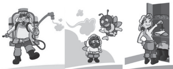
Figura 1. Personajes creados para la estrategia educativa

Fuente: elaborados por Pedro Arce y Ronald Jiménez.