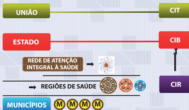
Figura 1 – Níveis de Organização do Espaço da Gestão Interfederativa do SUS

Para assegurar ao usuário o acesso universal, igualitário e ordenado às ações e serviços de saúde do SUS, caberá aos entes federativos, nas Comissões Intergestores, garantir a transparência, a integralidade e a equidade no acesso às ações e aos serviços de saúde; orientar e ordenar os fluxos das ações e dos serviços de saúde; monitorar o acesso às ações e aos serviços de saúde; e ofertar regionalmente as ações e os serviços de saúde.