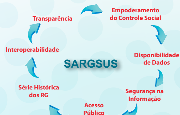
Figura 2 – Qualificação da gestão: Objetivos do SARGSUS

O SARGSUS tornou-se de uso obrigatório a partir da publicação do Acórdão do Tribunal de Contas da União nº 1.459, de 1º de junho de 2011, e da pactuação tripartite, em dezembro de 2011, retratada na Portaria MS/GM nº 575, de 29 de março de 2012.