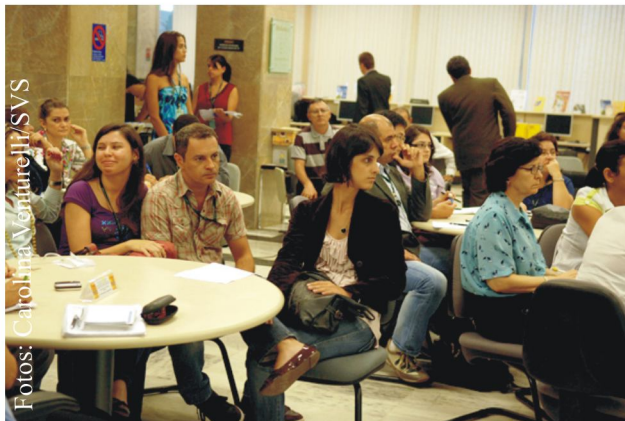
Participantes do 1.º Café com Idéias de 2010, realizado na Biblioteca do Ministério da Saúde.

Dentre as mudanças que mantêm interface com as diretrizes do Pacto pela Saúde, destacam-se a substituição do processo de certificação dos municípios para recebimento de recursos destinados à vigilância em saúde pelo processo de adesão ao Pacto pela Saúde, por meio da formalização do Termo de Compromisso de Gestão (TCG); a inserção da vigilância em saúde nos instrumentos de Planejamento do SUS - PPI, PDI e PDR, a incorporação dos resultados das ações desenvolvidas no Relatório Anual de Gestão (RAG); e o financiamento em bloco das ações do setor.