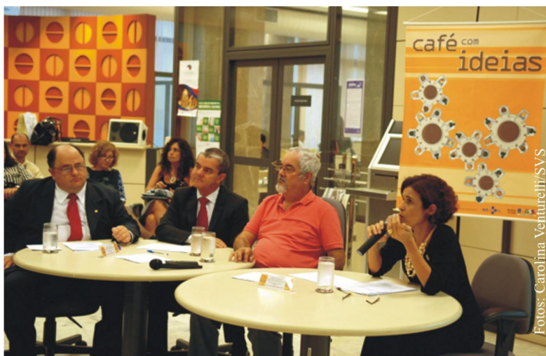
1º Café com Idéias discute as novas diretrizes para a vigilância em saúde.