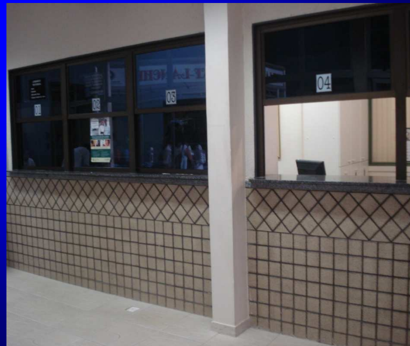
Centro de Análises Clínicas Rômulo Rocha – FF/UFV