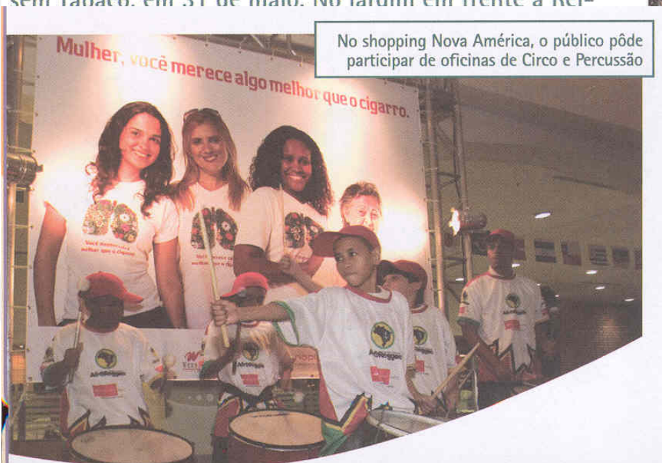
No shopping Nova América, o público pôde participar de oficinas de Circo e Percussão