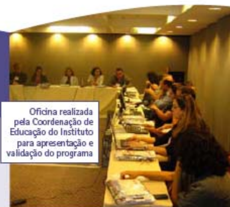
Oficina realizada pela Coordenação de Educação do Instituto para apresentação e validação do programa

A Divisão de Apoio à Rede de Atenção Oncológica, em parceria