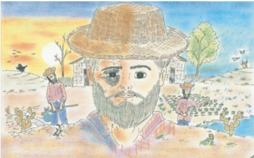
Inverno e Seca - as duas faces do sertanejo - Do sertão à favela - Projeto Quatro Varas

Neste documentário, procura-se identificar essas entidades e propor-lhes uma colaboração de médicos e pais-de-santo, num trabalho preventivo contra a aids, que culminou com a elaboração do vídeo: Abra os caminhos e feche o corpo contra a aids.