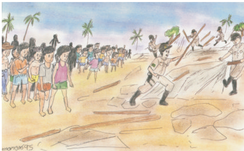
A violência da polícia - Do sertão à favela - Projeto Quatro Varas

Este vídeo mostra como São Francisco das Chagas de Canindé aparece no sonho dos romeiros. Procuramos apresentar o resultado de uma pesquisa sobre o processo da cura por meio dos santos padroeiros dos peregrinos nordestinos.