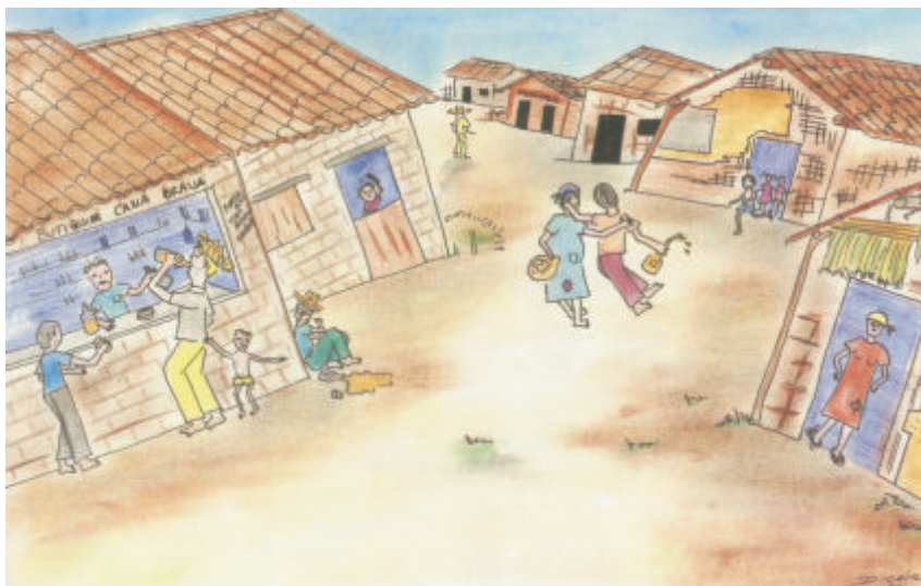
A agonia da família - Do sertão à favela - Projeto Quatro Varas

Trata-se de uma visão global de como funciona a terapia comunitária. Partindo-se de situações como alcoolismo, tentativa de suicídio, doença dos nervos e violência, procura-se mobilizar os recursos comunitários, suscitando a capacidade terapêutica do próprio grupo.