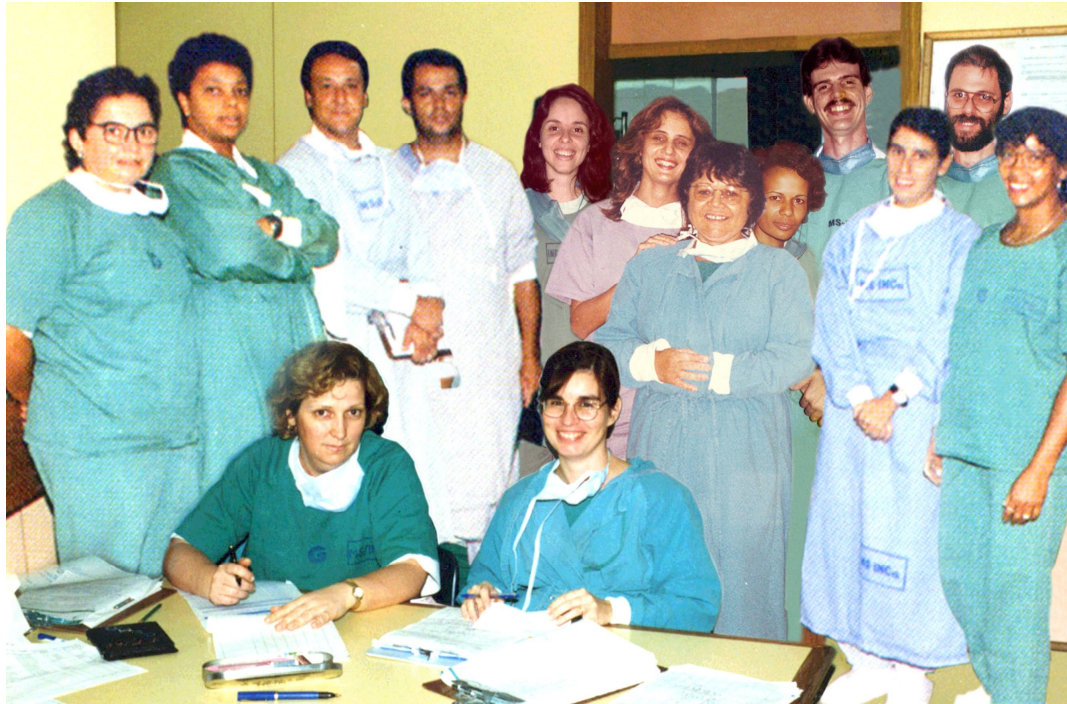
EQUIPE MULTIPROFISSIONAL DO CEMO COM A INDUMENTÁRIA DE TRABALHO

A foto a seguir ilustra o que foi relatado.