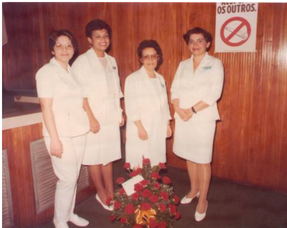
CERIMÔNIA DE POSSE DA CHEFE DA DIVISÃO DE ENFERMAGEM DO INCa