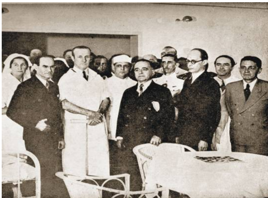
INAUGURAÇÃO DO CENTRO DE CANCEROLOGIA EM 14 DE MAIO DE 1938