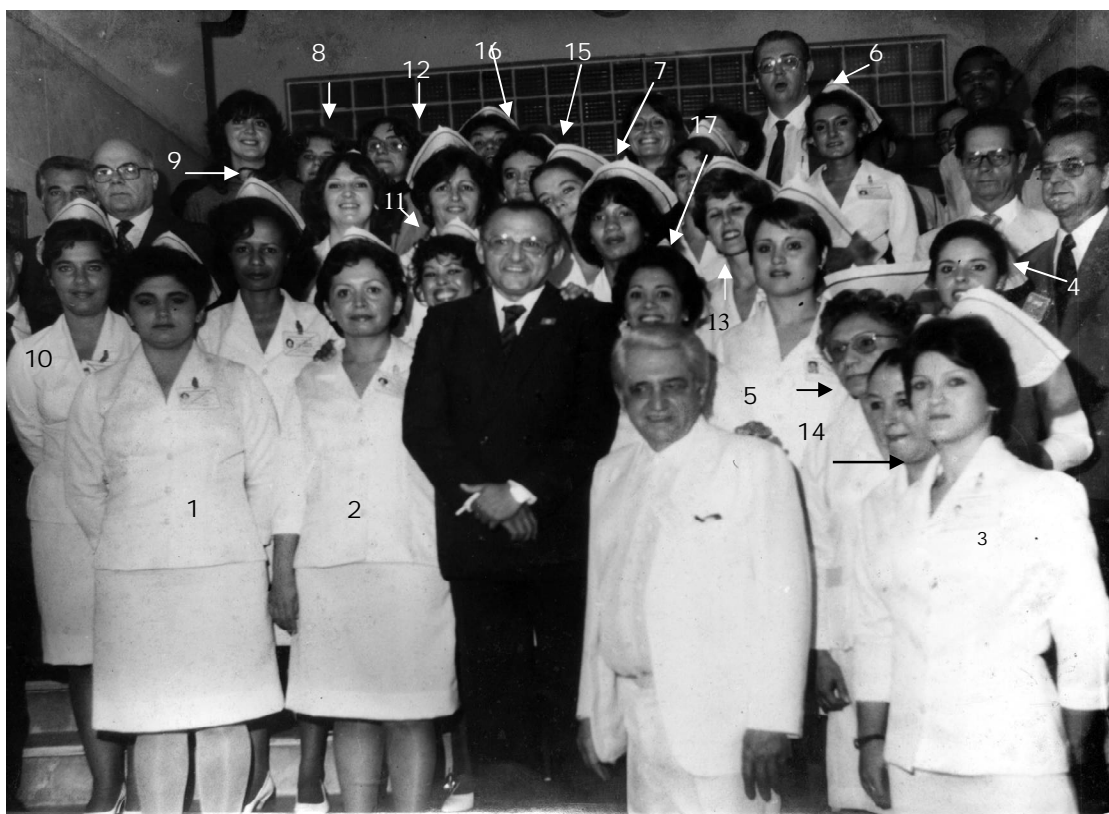
INAUGURAÇÃO DO CEMO, EM 06 DE JUNHO DE 1983

A importância da inauguração do CEMO pôde ser comprovada pela presença do então Ministro da Saúde, Dr. Waldyr Mendes Arcoverde que, na foto abaixo, aparece ladeado pelo então Diretor do Instituto Nacional de Câncer e enfermeiros da Instituição, condignamente vestidos para a ocasião.