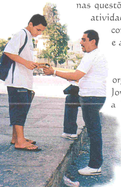
Abordagem de rua

2 - CEDECAT - O Centro de Defesa da Criança e do Adolescente Trabalhadores é um projeto especializado nas questões relativas ao trabalho de crianças e adolescentes brasileiros. Promove, dentre outras atividades, ações na área trabalhista e cível, quando decorrentes da relação de trabalho e tem como objetivo contribuir para erradicação do trabalho infantil e a proteção do trabalho do adolescente.