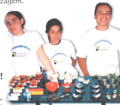
Curso de auxiliar de prótese dentária

SEJA NOSSO PARCEIRO. SOLICITE A VISITA DOS PROJETOS EM SUA COMUNIDADE!