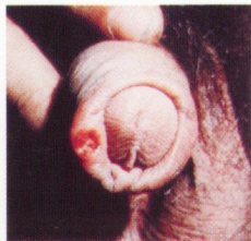
Sifilis 1ª fase