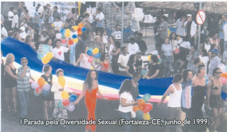
I Parada pela Diversidade Sexual (Fortaleza-CE, junho de 1999)