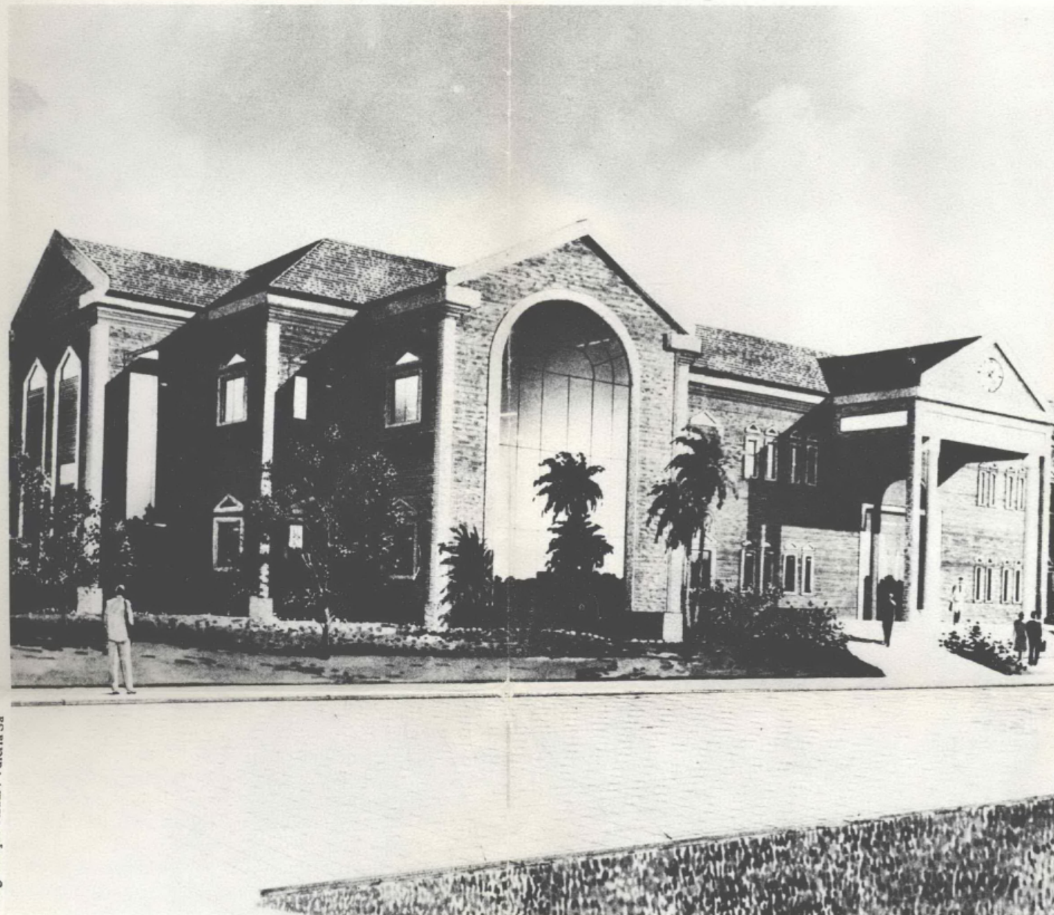
Programação visual: Valéria Sá