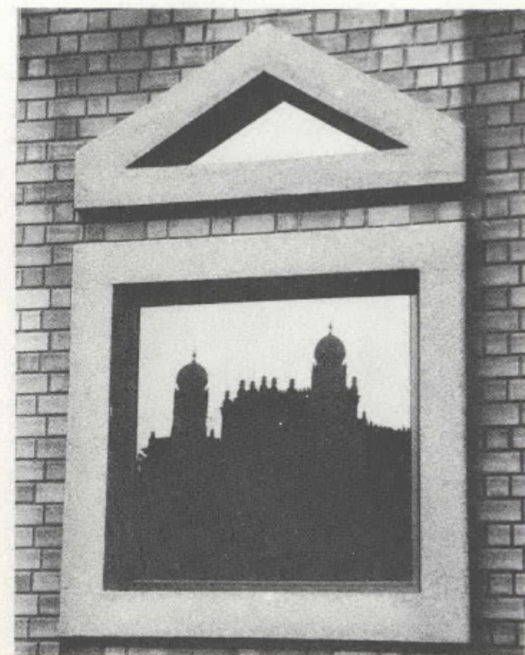
Detalhe da nova Biblioteca