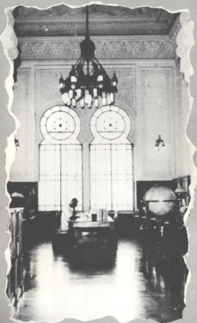
Salão de Leitura