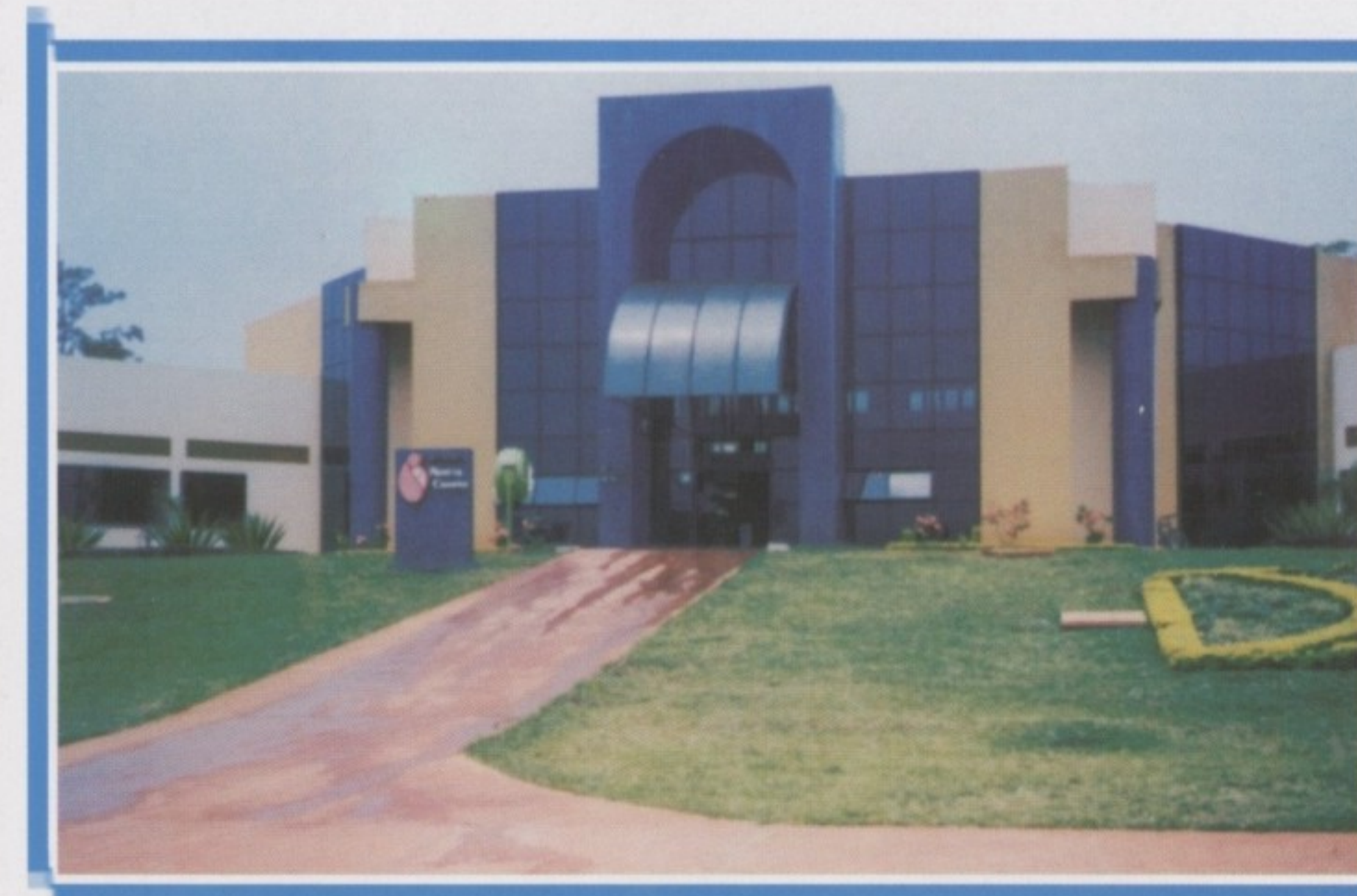
Maternidade Nascir Cidadão, na Região Noroeste de Goiânia - Avenida Oriente, Jardim Curitiba III.

A participação da comunidade da região, por intermédio dos Conselhos Locais de Saúde, e outras entidades representativas, foi e continua sendo a sustentação de uma política de saúde regionalizada e mais humana. A Prefeitura de Goiânia incentiva esta participação e cumpre as diretrizes traçadas pela comunidade e os profissionais do setor, ligados à Secretaria Municipal de Saúde, dentro das normas do SUS e integra todo serviço da maternidade às suas unidades.