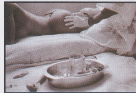
Aplicação segura de silicone em travestis