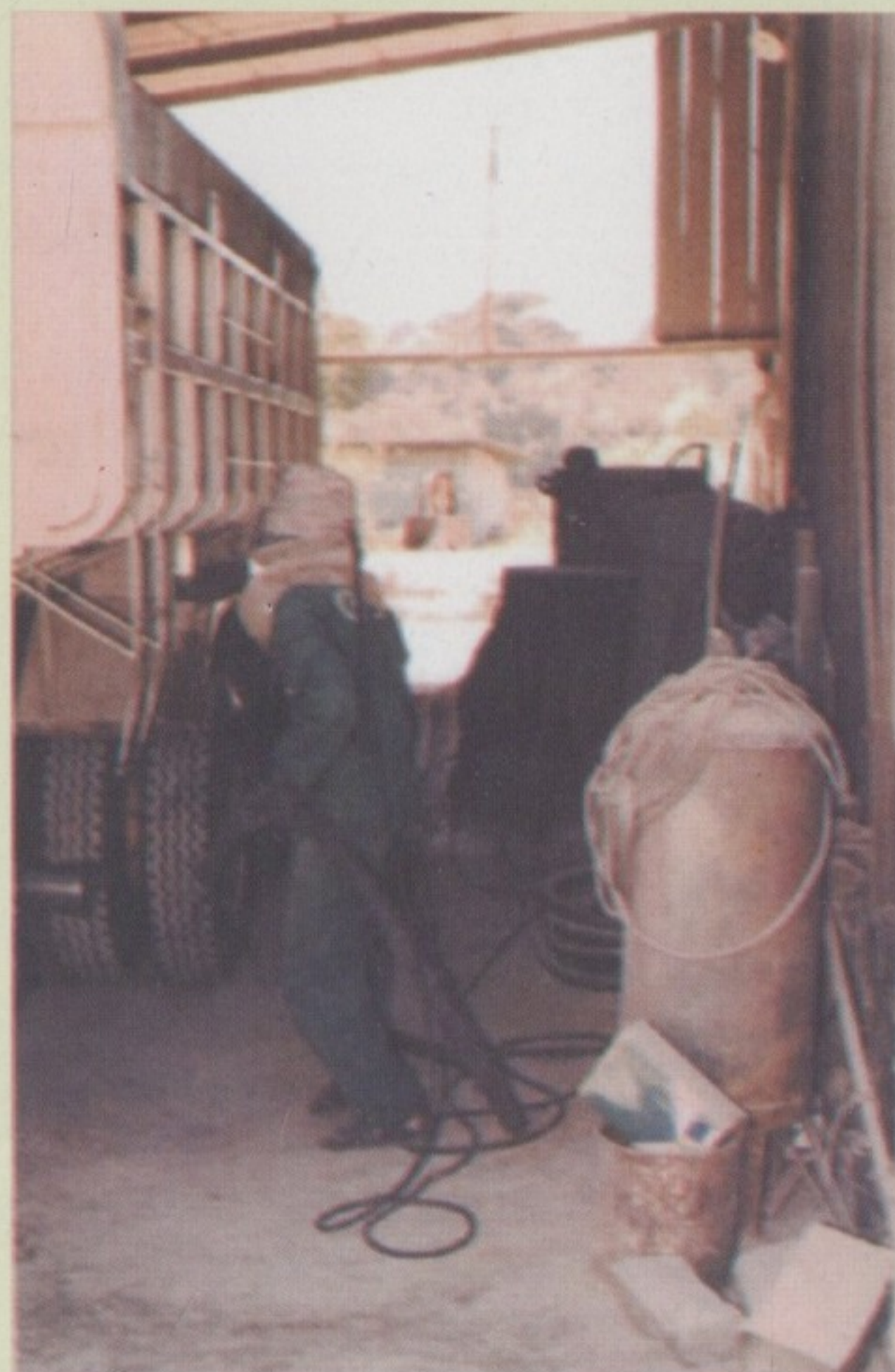
Figura 1- Foto cedida pelo CEMAST

O trabalhador tem direito de recusar atividades que ofereçam risco grave e não tenham proteção adequada.