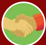
ABRAÇO E APERTO DE MÃOS