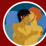
SEXO SEM CAMISINHA