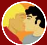
BEIJO NA BOCA