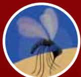
PICADA DE INSETO