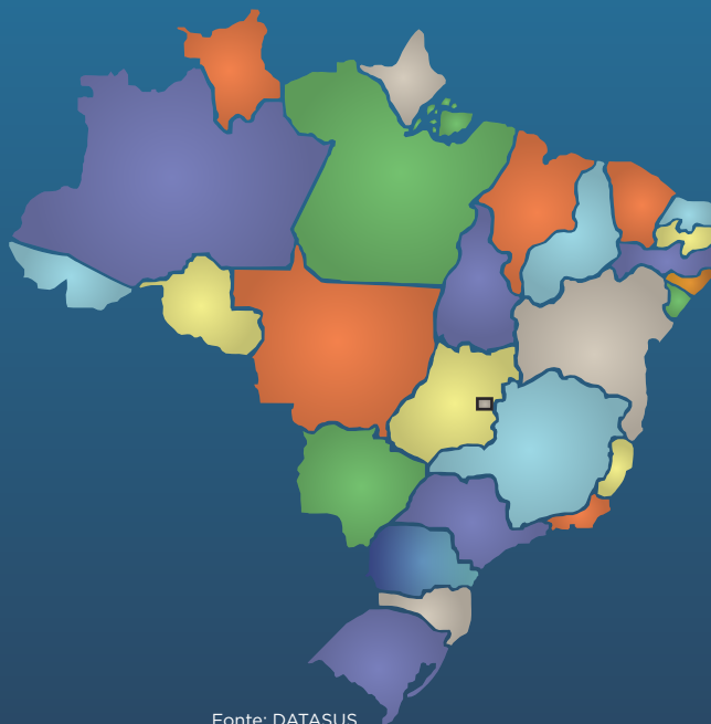
Figura 1 – Mapa – Regiões do Brasil

Tabulador genérico, de domínio público, que permite organizar dados conforme o objetivo da pesquisa feita, ao tabular, juntos ou separados, diferentes tipos de dados no mesmo ambiente.