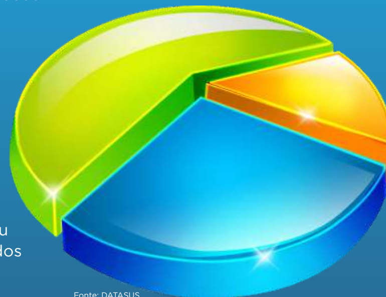
Gráfico 1 – Gráfico de setores