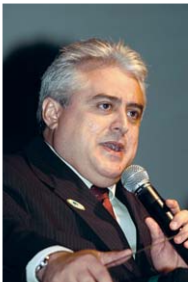
Luiz Odorico de Andrade Presidente do Conasems

Saúde: um direito de todos e dever do Estado – a saúde que temos, o SUS que queremos