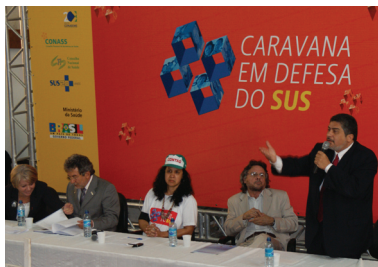
Caravana em Defesa do SUS do Distrito Federal