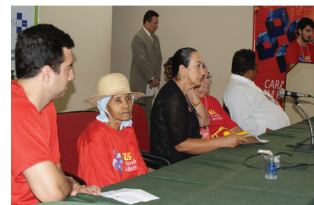
Caravana em Defesa do SUS do Piauí

Acompanhe no site do CNS matérias e fotos das Caravanas realizadas nas capitais do Maranhão, Ceará, Rio Grande do Norte, Paraíba, Espírito Santo, Rondônia, Pernambuco, Acre, Manaus, Boa Vista, Rio de Janeiro, Distrito Federal e Piauí, além do calendário atualizado até o mês de dezembro, quando haverá o encerramento, em Brasília. A Caravana segue no mês de outubro para São Paulo (8), Pará (22), Minas Gerais (26) e Alagoas (29).