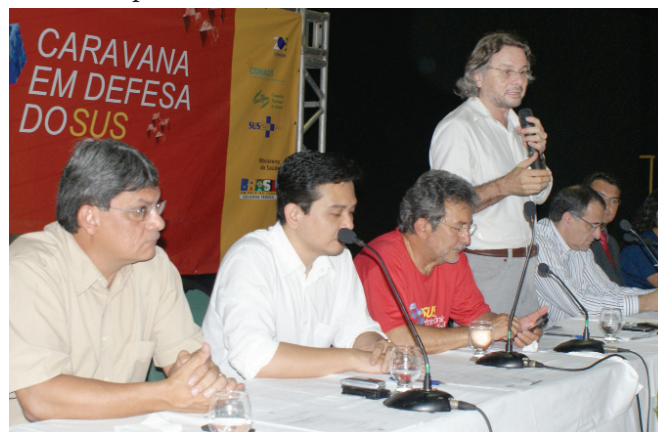
Caravana em Defesa do SUS do Amazonas