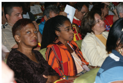
Caravana em Defesa do SUS do Rio de Janeiro