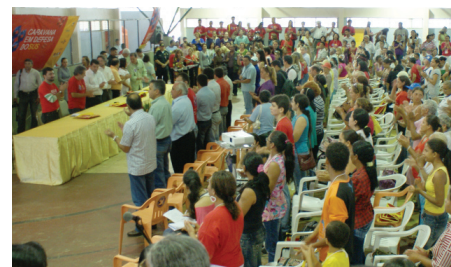
Caravana em Defesa do SUS de Roraima

Dois estados da Região Norte do Brasil realizaram a Caravana em Defesa do SUS reunindo cerca de 1.500 pessoas em Manaus e Boa Vista, nos dias 17 de agosto e 1º de setembro, respectivamente.