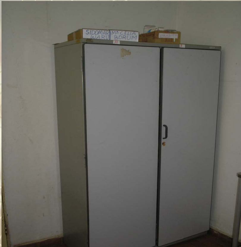
Armário em MDF localizado no PE da CASAI Belém