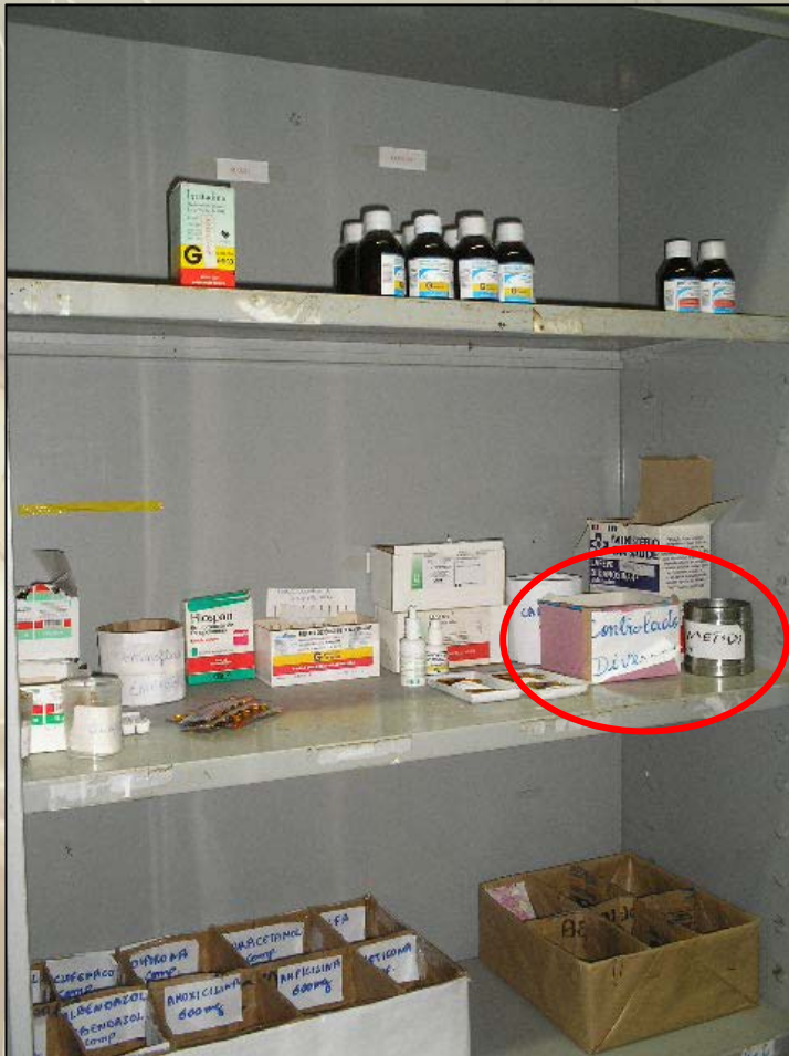
Armário de aço da farmácia-auxiliar da CASAI do Amapá