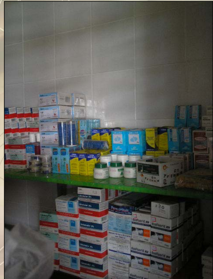
Medicamentos armazenados na área interna da sala que funciona como depósito.