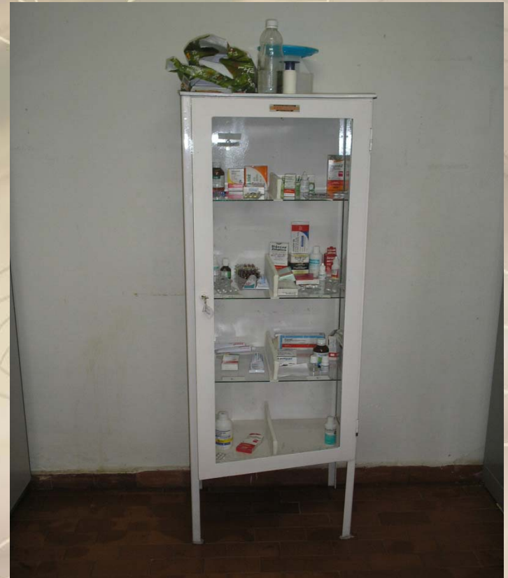
Armário de ferro localizado no PE da CASAI Belém