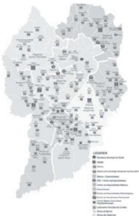
Figura 1 - Rede de Serviços do SUS Curitiba

A Rede de Atenção da Secretaria Municipal de Saúde de Curitiba é composta por: