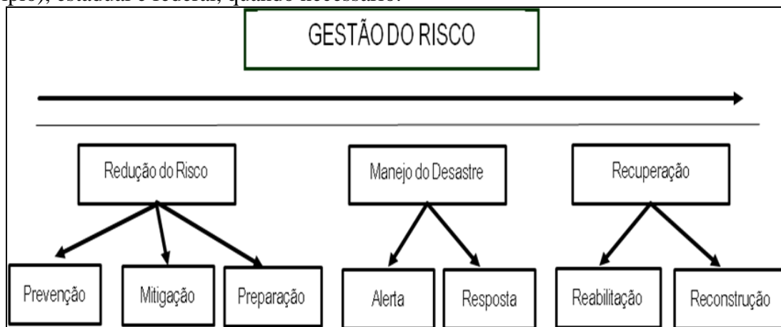
Figura 1 – Modelo de Atuação de Gestão do Risco

Vale ressaltar que a gestão do risco tem como cenário primordial de ação o município, com o apoio das esferas regional (relação direta com a regional de saúde de área de abrangência do município), estadual e federal, quando necessário.