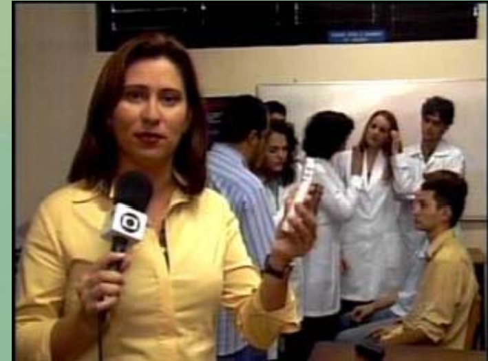
Visita aos hospitais