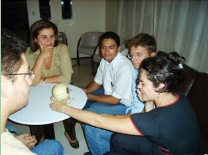
Multiplicação com os estudantes de Medicina