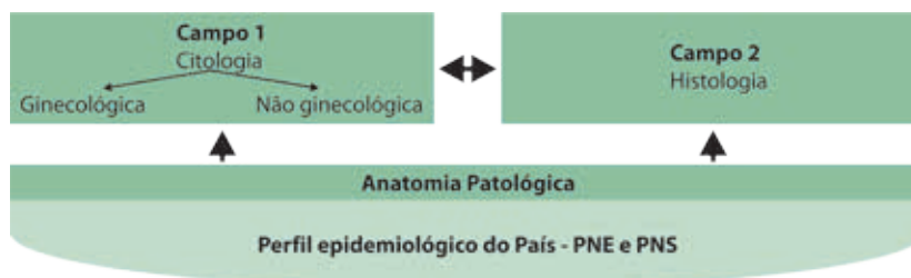
Figura 1 - Esquema de Estrutura de Saberes

Segundo o Catálogo Nacional de Cursos Técnicos do MEC (2010), o curso técnico em citopatologia é um dos cursos agrupados no eixo tecnológico Ambiente, Saúde e Segurança que: